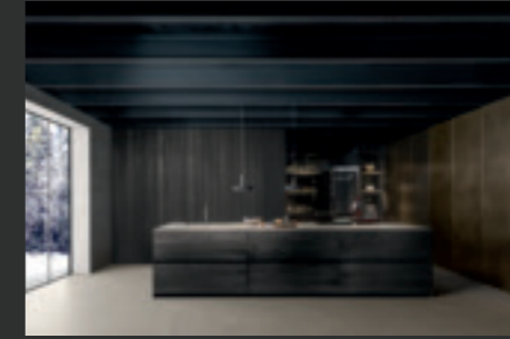
12 FLY FLOAT