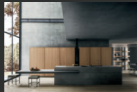
8 TWENTY FRAME