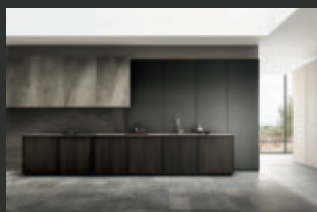
9 FRAME BLADE