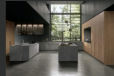
16 TWENTY FLY