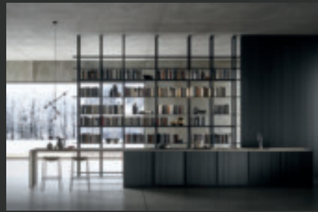
3 FRAME BLADE