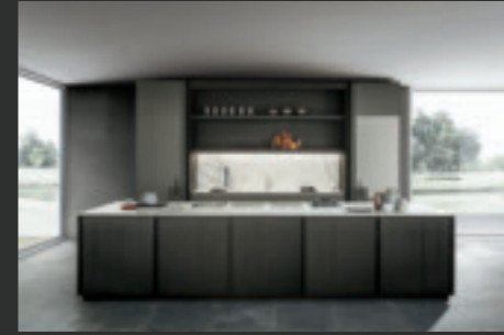
11 FRAME BLADE