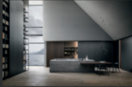
1 BLADE LAB