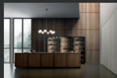
10 FRAME BLADE