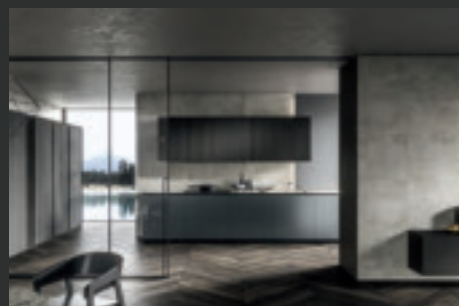
7 SKILL FRAME